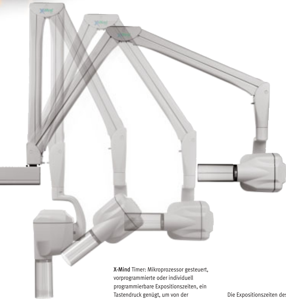
Langkonus 31 cm (12"), Röntgenkopf schwenkbar um 395°

X-Mind Timer: Mikroprozessor gesteuert, vorprogrammierte oder individuell programmierbare Expositionszeiten, ein Tastendruck genügt, um von der herkömmlichen (auf Röntgen-Filmtechnik) zur digitalen Bilderfassung mittels Sensortechnik zu wechseln. Tasten vorprogrammiert für Spezial-Aufnahmen.